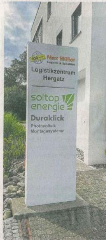
Der Pylon am neuen Standort zeigt, wer dort beheimatet ist.